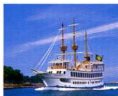
▲冬の九十九島めぐりも、パールクイーンなら暖かい船内でゆっくりお楽しみいただけます。